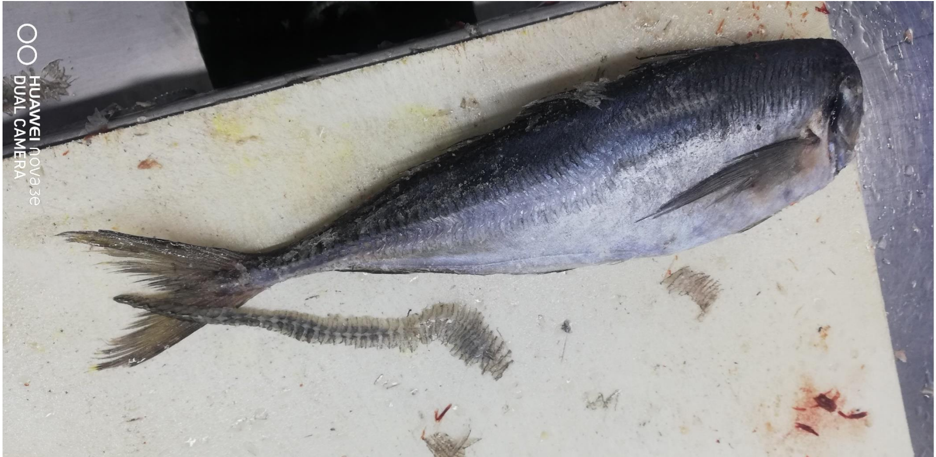
ゼイゴ除去後状態