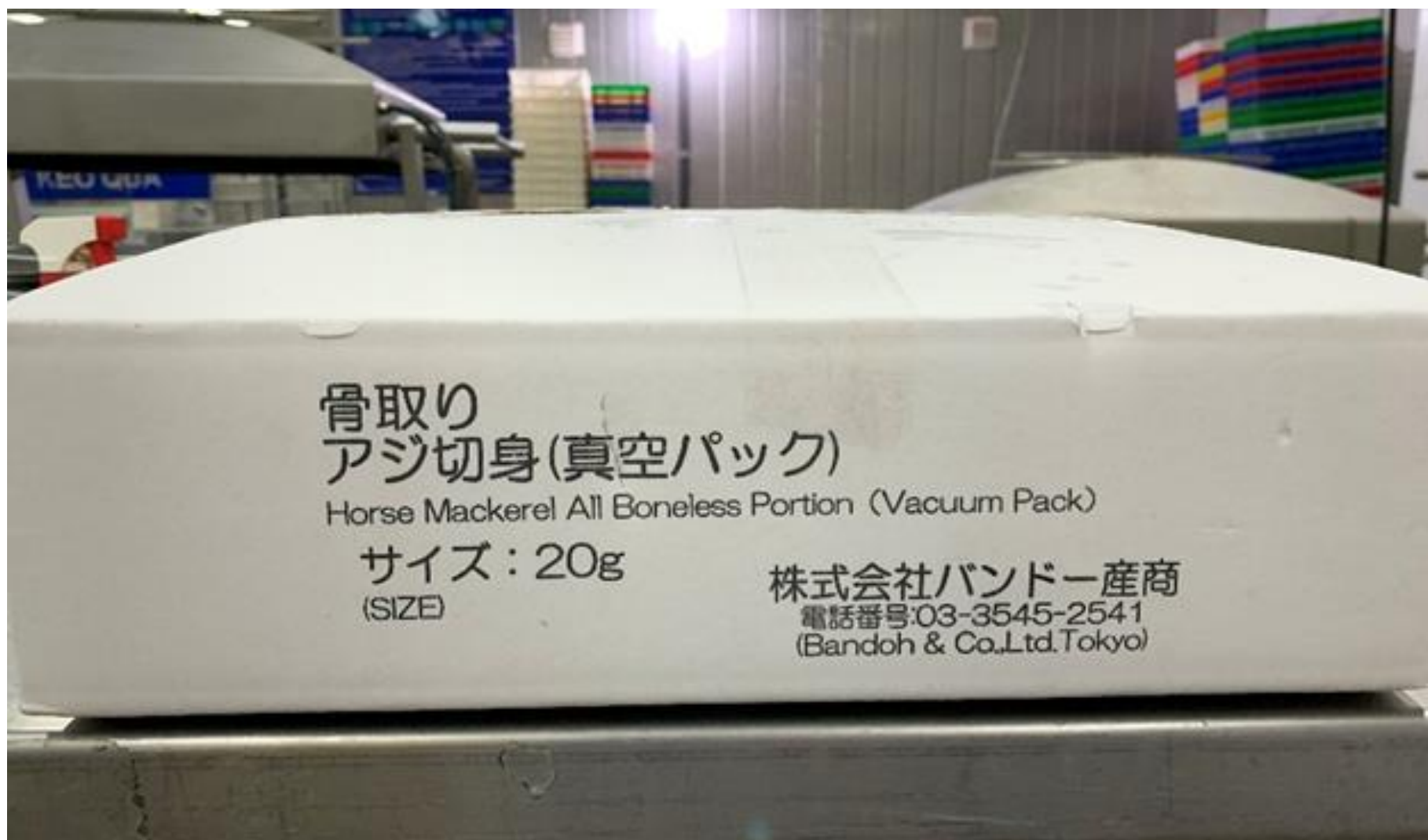
外装側面 (単箱 5KGS)