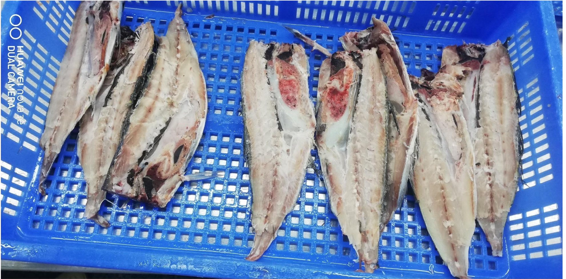
おろし後ファイル