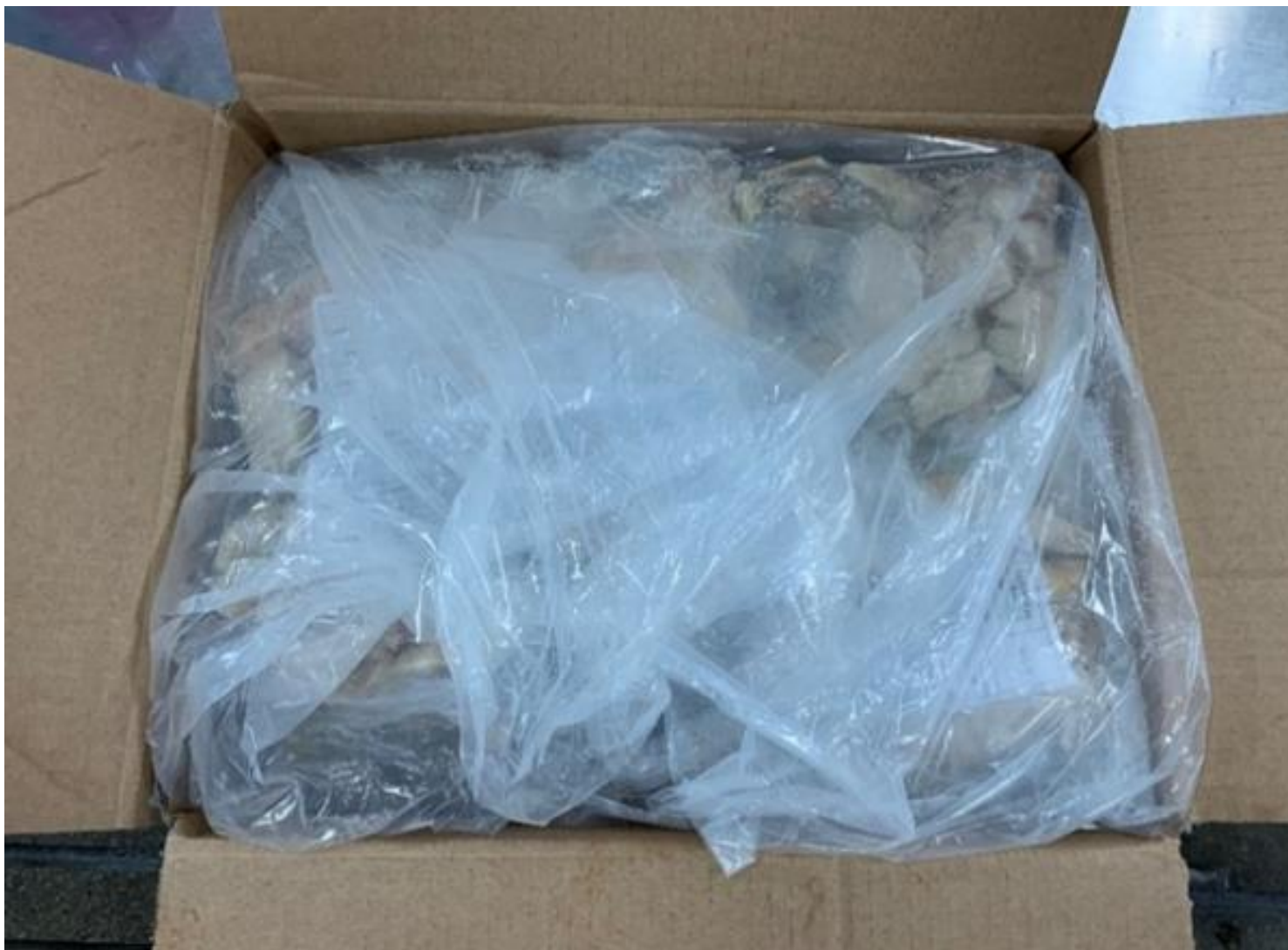
製品内容 (単箱 5KGS)