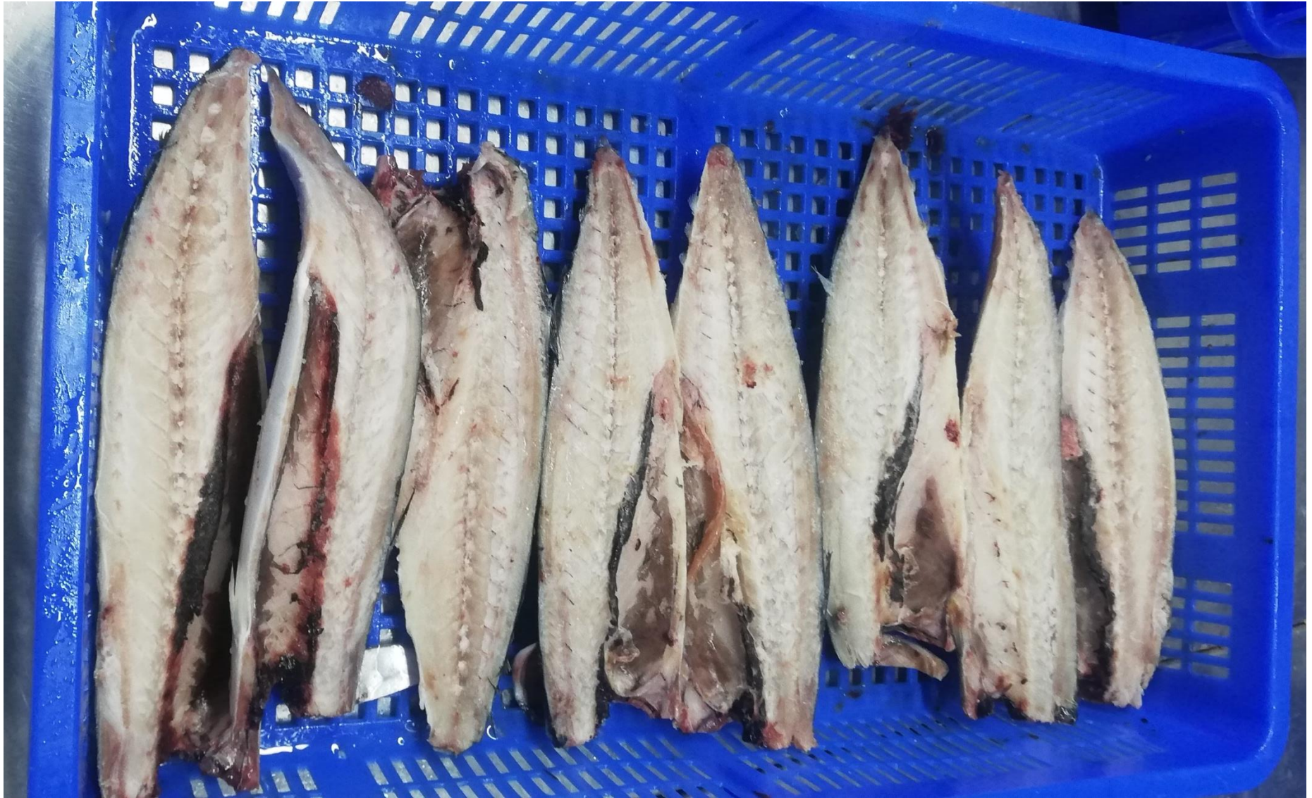
おろし後ファイル