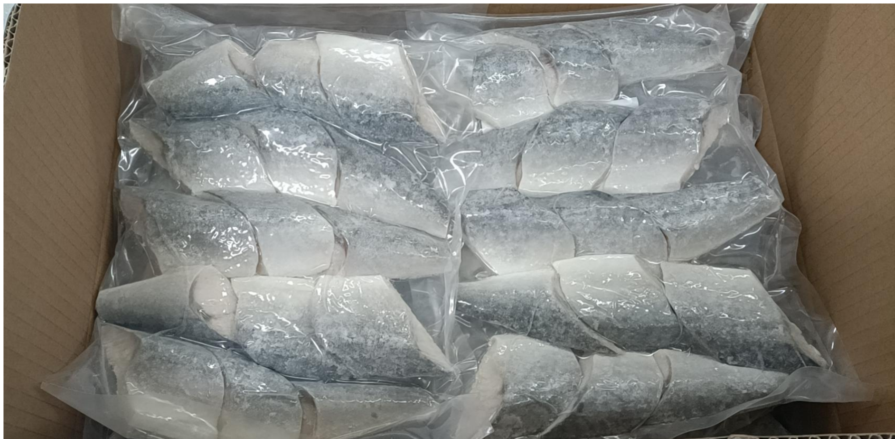
製品内容 (単箱 6KGS)