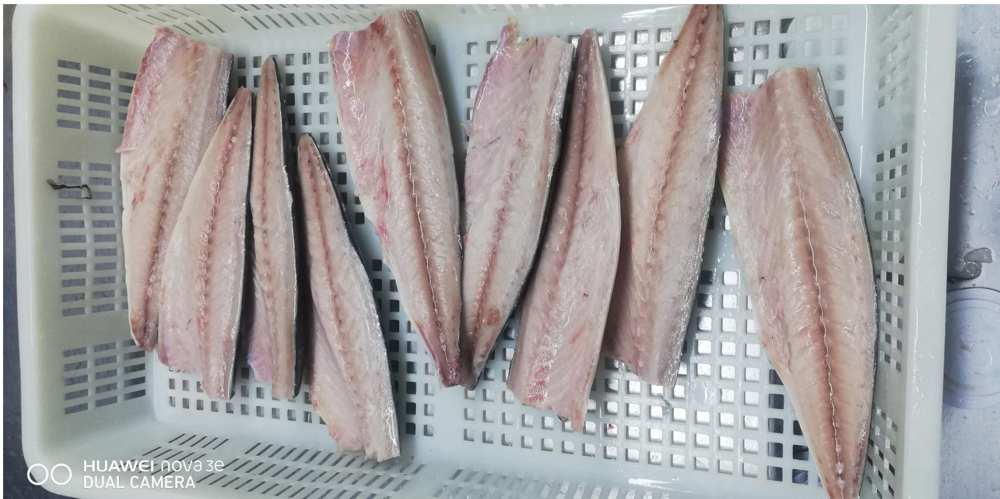
洗滌黒膜除去後フィレ