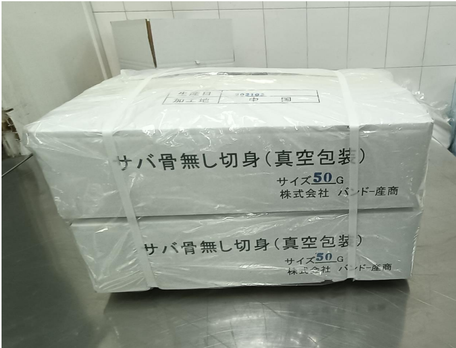
外装正面 (6KGS X 2合)