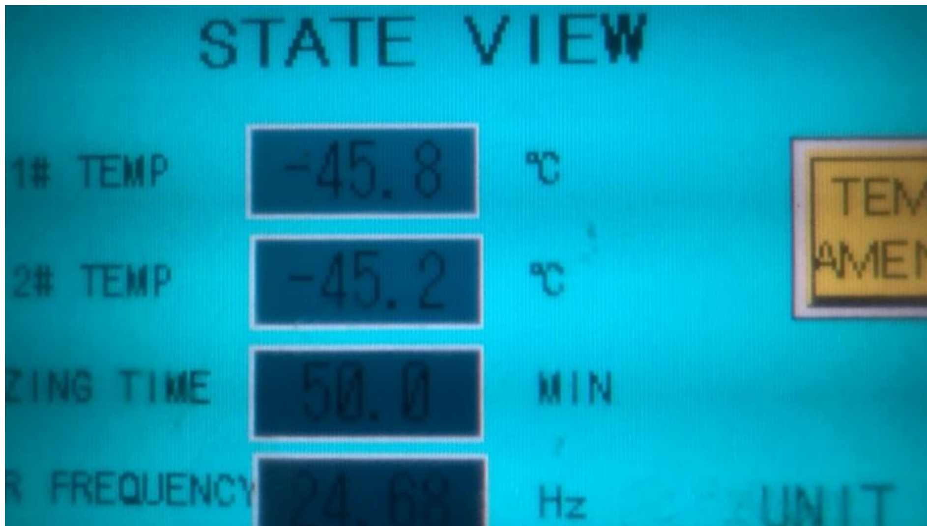
スパイラル冷凍（冷凍温度 -45^{\circ}\text{C} 以下、冷凍時間約 40 分）