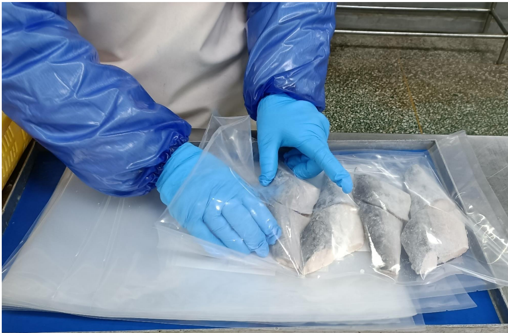
切身を真空袋に揮入工程