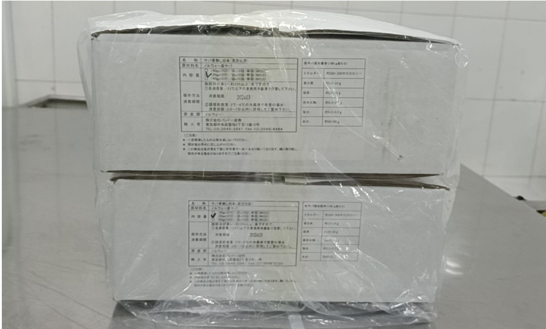
外装側面 (6KGS X 2合)